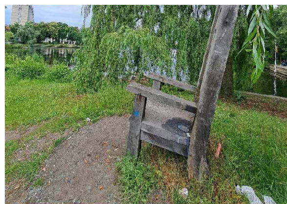
Station 1 Lange Brücke Station 2 Brachfläche gegenüber Hbf Station 3 runde Bank Station 4 Stuhl