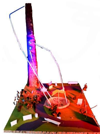
Die Schüler:innen fotografieren ihre Modelle selbst mit einer Profikamera und Bühnenleuchten